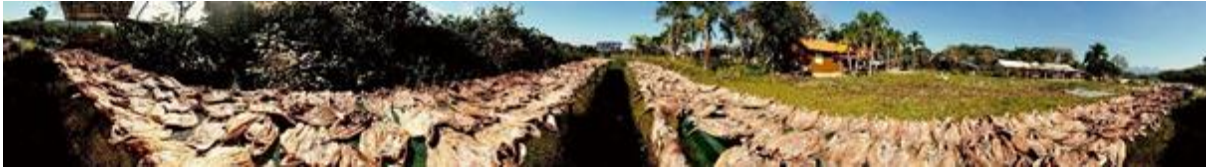
FIGURA 2 - FOTOGRAFIA DO PROCESSO DE SECAGEM DA TAINHA

começaram, para a secagem de todos os tipos de peixe, que também exigem cuidados, “quando está sol fraco, aí fica mais dias”, lembra a E2.